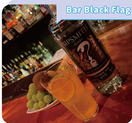
Bar Black Flag

JR高槻駅西口から徒歩5分。喧騒を離れ、 そっと大人の時間へと切り替わる—— ビルの4階にひっそりと佇む、黒を基調とし